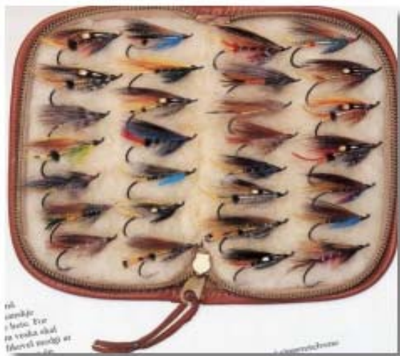
Författarens flugaskar är fyllda med dyrgripar som gör vem som helst avundsjuk.