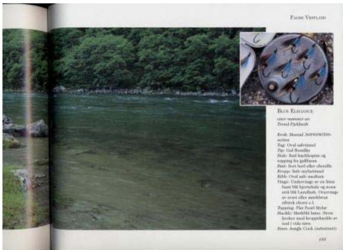
De fantastiskt fina bilderna förklarar i färger vad han menar med en vis typ av "vatten karaktär". Flugan som passar bäst i jakten på älvens "silver blanka" laxar står på samma sida med bindbeskrivningen. Det gör han så, för att man inte skall kunna göra fel flugval! Pedagogiskt och lärorikt till och med för de "ike" läskunniga

Han försöker designa sina flugor i klassisk stil men använder en del ny/gamla material, så att flugorna blir fiskliga och förtroendeingivande. Bilder på hans mycket fina flugor finns överallt i boken. Det som är så fantastiskt bra är att det finns hänvisningar i texten på hur man fiskar med just den fluga som vi ser, varför, hur man väljer storlek ... osv. Lärorikt, spännande och vackert, allt på samma gång!