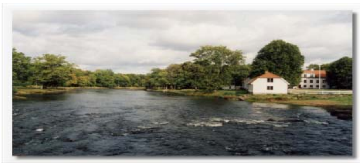
Em - september

Under det sista året har jag arbetat intensivt med en bok om Emån med ovanstående titel. Boken, är indelad i 15 kapitel och handlar framför allt om sportfisket i Emån, som betraktas som ett av det allra förmämsta fiskevatten i världen. Detta främst tack vare en unik stam av havsöring, med individer som räknas till de allra största och grövsta i hela världen.