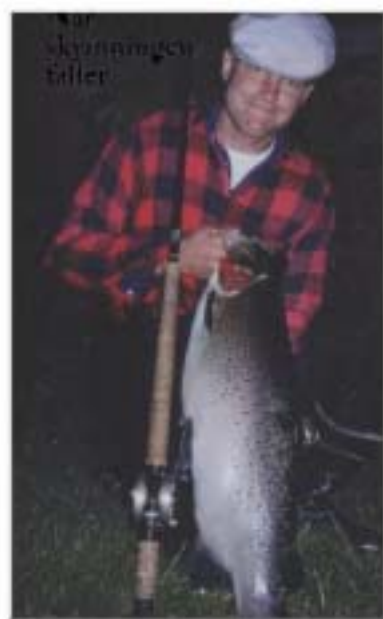
Pelle med en vackert Emöring

En utförlig presentation av de äldre, speciellt för Emån, skapade Emflugorna plus några moderna varianter finns med. Profiler vid ån som Gustaf Ulfsparré, Göran Ulfsparré, Stig Nilsson, "Olle-Spik" m.fl. kommer till tals. Boken innehåller också utdrag och foton från de material som Gustaf Ulfsparré en gång i tiden påbörjade, men tyvärr aldrig hann avsluta under sin levnad. Där finns mycket spännande läsning!